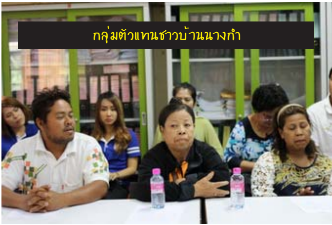
กลุ่มตัวแทนชาวบ้านนางกำ

โดยบางส่วนได้ดำเนินการเสร็จสิ้นไปแล้ว เช่น การจัดทำแผนที่ท่องเที่ยวทางทะเลและคอนโดปลาโลมา บางส่วนยังคงทำต่อไปอย่างต่อเนื่อง เช่น การสร้างชุมัคคุเทศก์ ที่ต้องผลิตชุมัคคุเทศก์รุ่นใหม่ทดแทนไปเรื่อย ๆ และบางส่วนอยู่ในระยะดำเนินการและการเตรียมการ